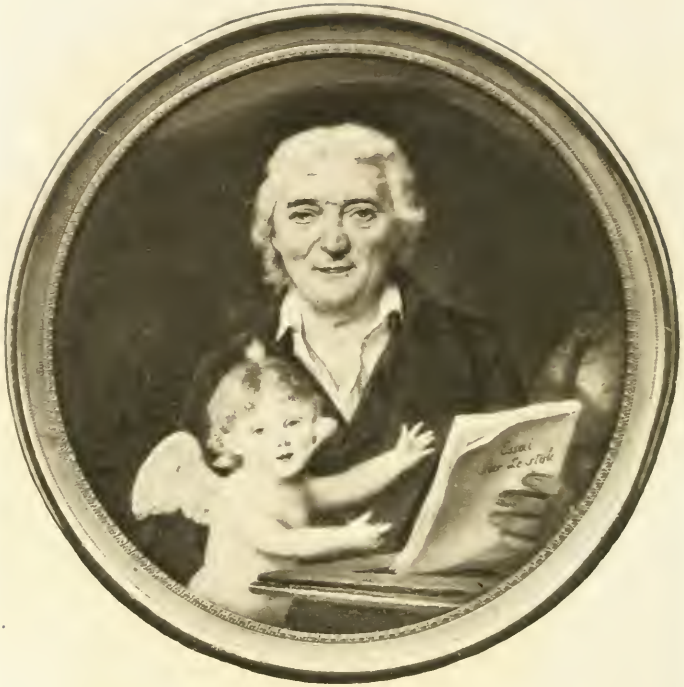
DR. DONNE THIBAULT Leve du general Thibault apres une miniature de Searcy